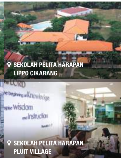
📍 SEKOLAH PELITA HARAPAN LIPPO CIKARANG