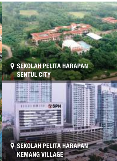
📍 SEKOLAH PELITA HARAPAN SENTUL CITY