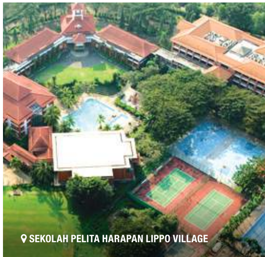
📍 SEKOLAH PELITA HARAPAN LIPPO VILLAGE