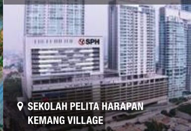
📍 SEKOLAH PELITA HARAPAN KEMANG VILLAGE