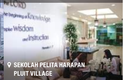
📍 SEKOLAH PELITA HARAPAN PLUIT VILLAGE