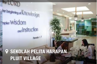
📍 SEKOLAH PELITA HARAPAN PLUIT VILLAGE