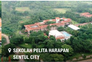
📍 SEKOLAH PELITA HARAPAN SENTUL CITY