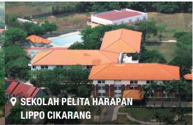
📍 SEKOLAH PELITA HARAPAN LIPPO CIKARANG