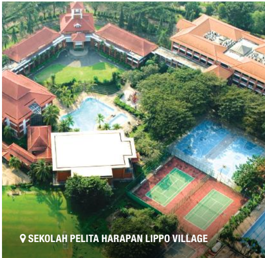
📍 SEKOLAH PELITA HARAPAN LIPPO VILLAGE