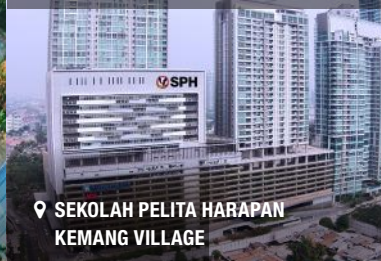
📍 SEKOLAH PELITA HARAPAN KEMANG VILLAGE