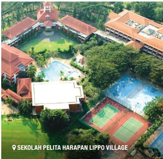
SEKOLAH PELITA HARAPAN LIPPO VILLAGE