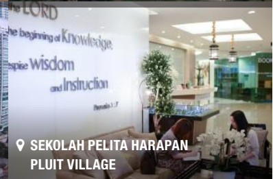
SEKOLAH PELITA HARAPAN PLUIT VILLAGE