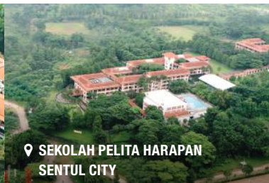
SEKOLAH PELITA HARAPAN SENTUL CITY