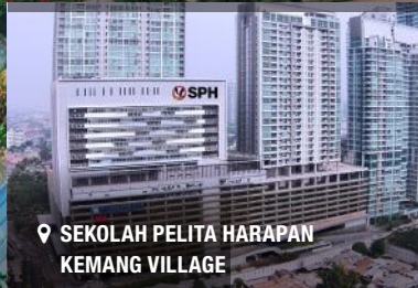
SEKOLAH PELITA HARAPAN KEMANG VILLAGE